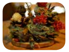
こんなのを作るよ!